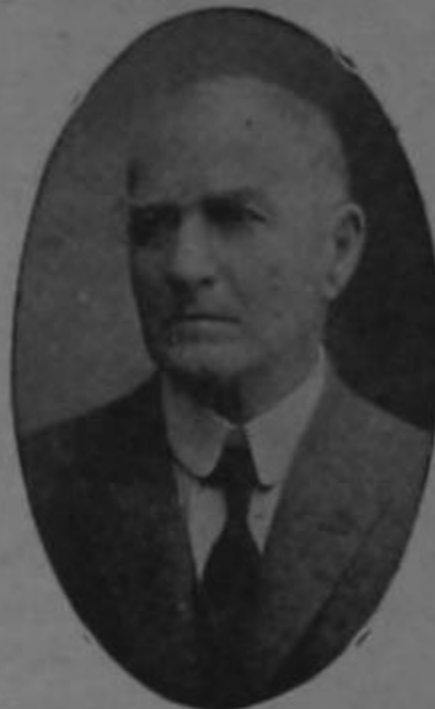
Gral. don JUAN Bta. QUIROS Ex-presidente de la República

Con el General don Juan Bautista Quirós desaparece uno de los costarricenses más ilustres. Fue la suya una existencia dedicada por completo al bien público. Desde su temprana juventud en que se iniciara en la política, hasta su exaltación a la primera magistratura de la Repu-